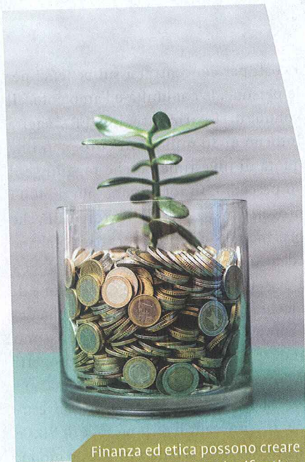
Finanza ed etica possono creare relazioni umane significative.