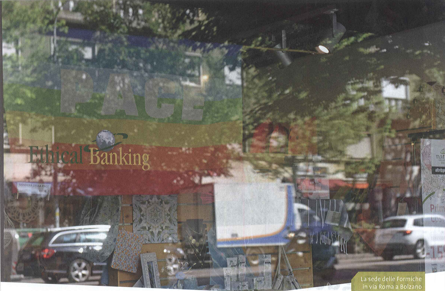
La sede delle Formiche in via Roma a Bolzano